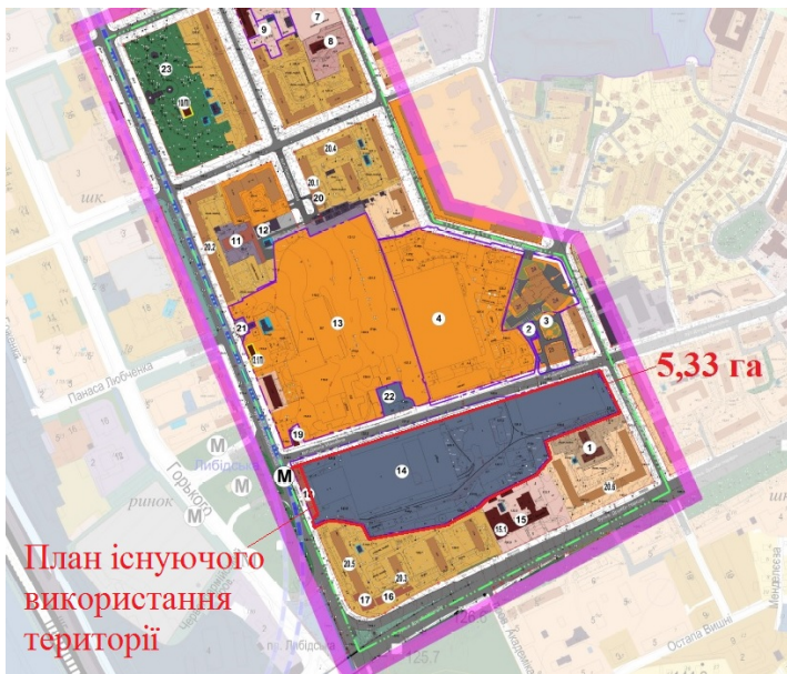
План існуючого використання території