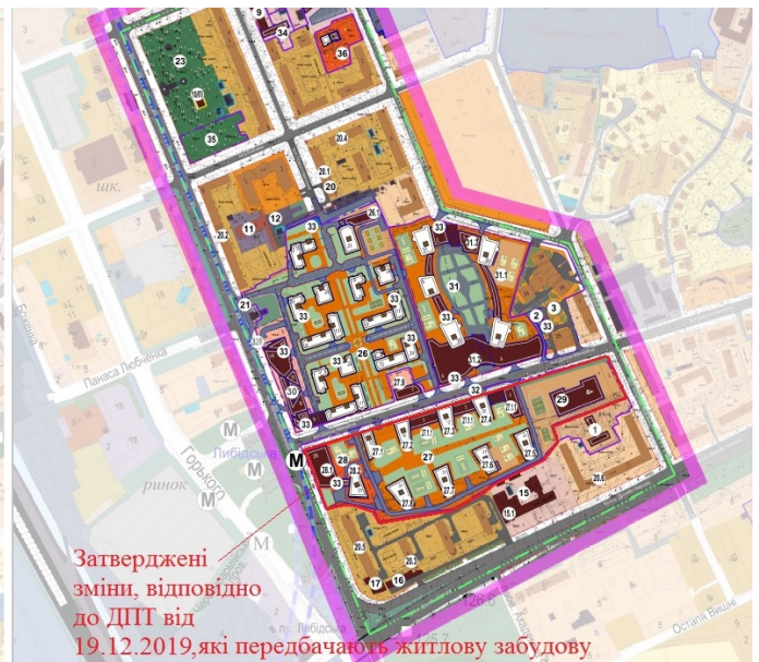
Затверджені зміни, відповідно до ДПТ від 19.12.2019, які передбачають житлову забудову

У вказаному ДПТ зазначили, що «на даний час ділянка ...не використовується за призначенням як промислова територія, а також має негативний вплив на прилеглу житлову забудову».