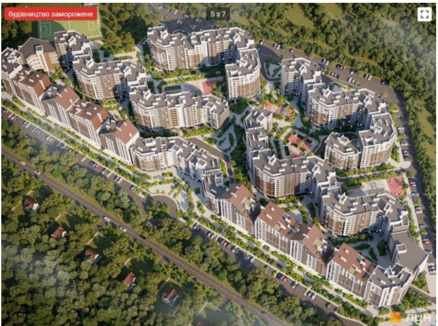
Проект ЖК Синергія Сіті

Суд наклав арешт на шість земельних ділянок загальною площею 29,2 га в Ірпені Київської області, де будується ЖК «Синергія Сіті», девелопером якого є фірма місцевого депутата, наближеного до экс-мера Ірпеня Володимира Карплюка . Про це свідчить ухвала Київського апеляційного суду від 4 листопада.