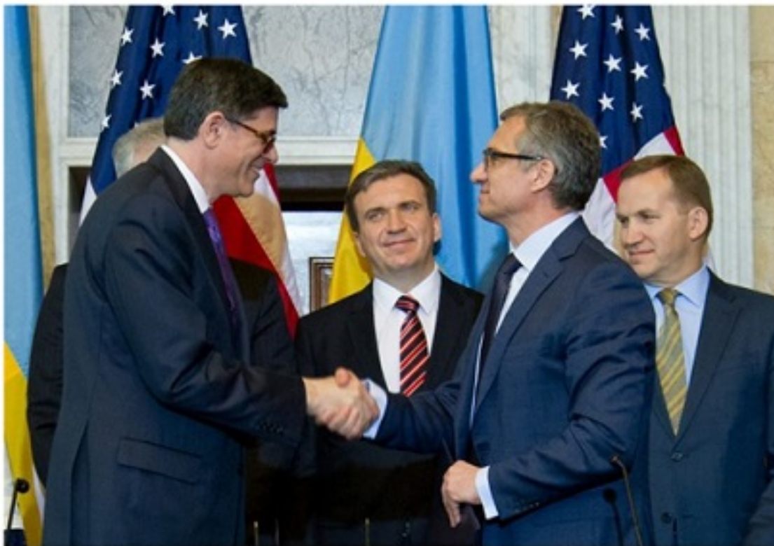
Shlapak meets US Treasury Secretary, Jacob Lew, on April 14, 2014

Во вторник спикера Госдепартамента (США) Мари Харф спросили ( ССЫЛКА ): «Как видим, гражданка США была назначена министром финансов (Украины). Имеет ли Вашингтон какое-то отношение к этому назначению»? Харф ответила: «Нет, это выбор украинского народа и его (вот!) представителей. Это их решение. Конечно, я не думаю, что мы вообще должны к этому иметь какое-то отношение... Украинский народ и его представители могут выбирать того, кого они хотят видеть в своём правительстве. В этом заключается прелесть того, как работает этот процесс».