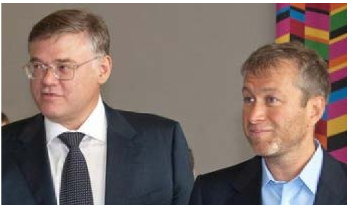
Российские олигархи Александр Абрамов (слева) и Роман Абрамович (справа)