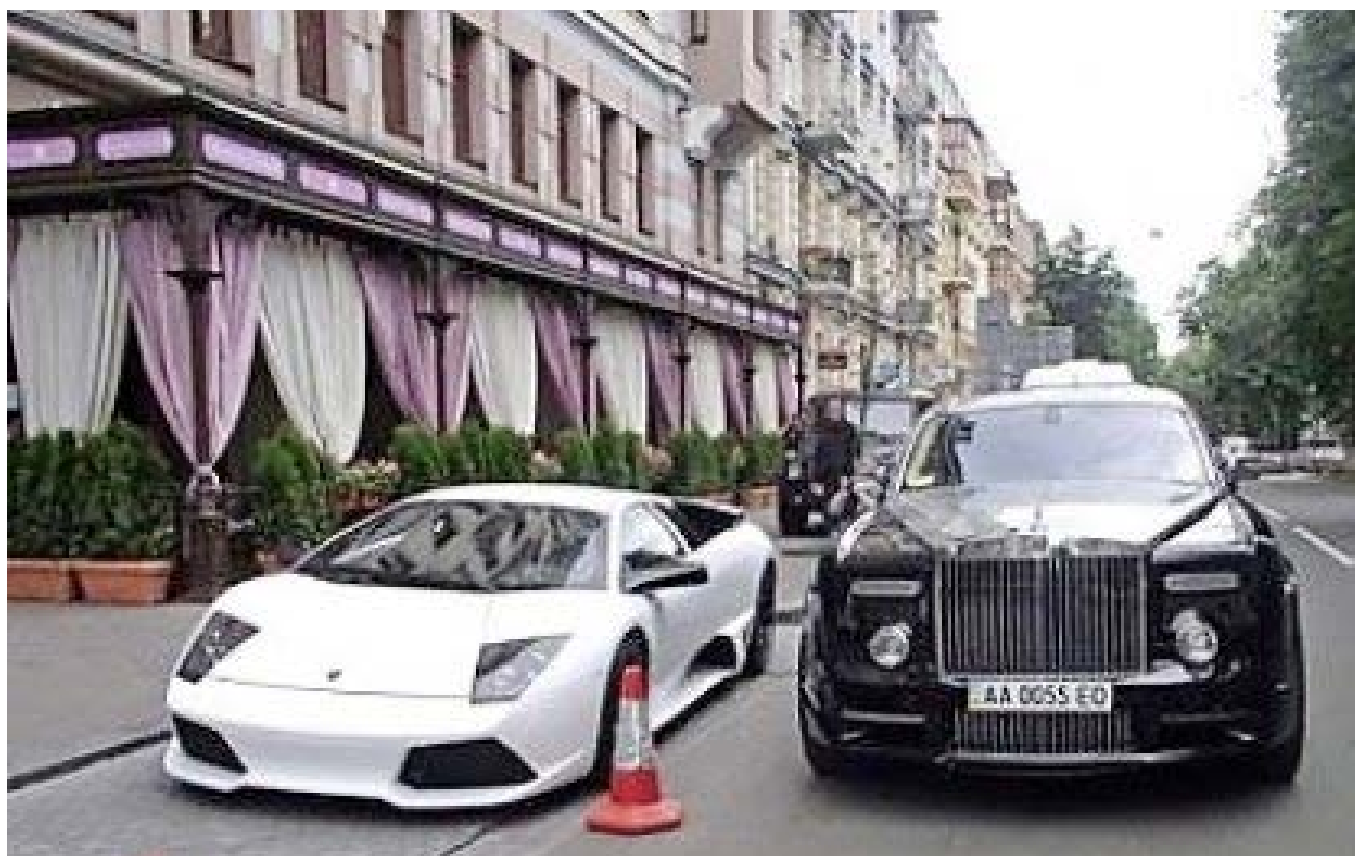
и его «Роллс-ройс»