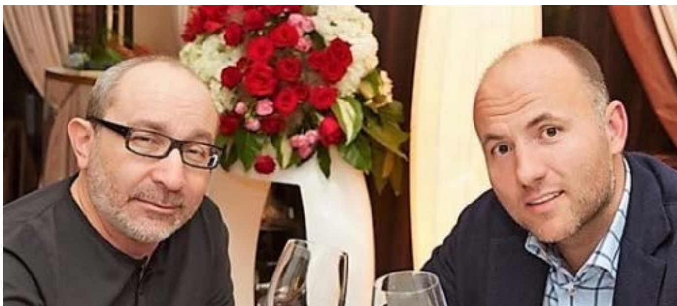
Геннадий Кернес и Павел Фукс