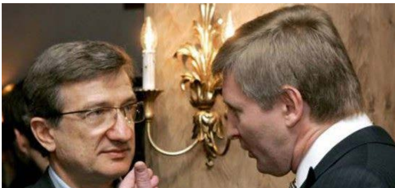
Сергей Тарута и Ринат Ахметов