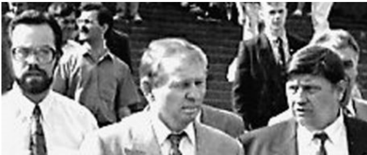
Дмитрий Табачник, Леонид Кучма и Александр Волков

Владимировича Леонид Кучма подписал распоряжение, которым запретил кому бы то ни было, кроме Табачника, использовать в служебных документах гриф «По поручению Президента».