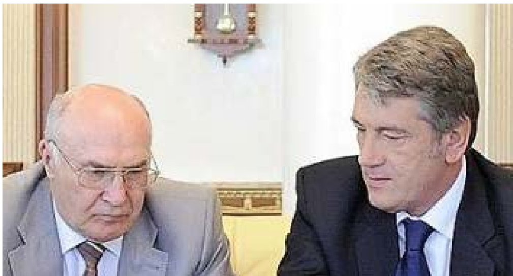
Правило двух: учитель и ученик

В следующие шесть лет Владимир Стельмах распоряжался Нацбанком уже на правах практически никем и ничем не ограничиваемого хозяина, неся прямую ответственность за вспыхнувший затем в стране финансовый и банковский кризис. Впрочем, если быть точным, то как раз никакой ответственности за это он так и не понес.