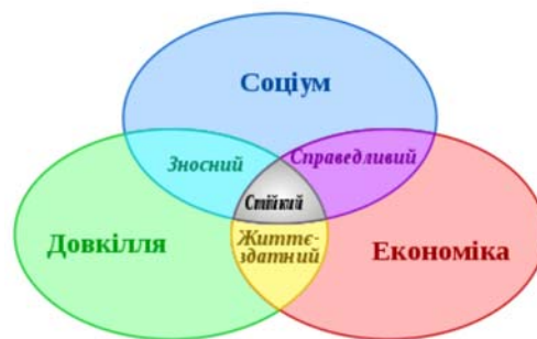
Триєдина концепція стійкого розвитку