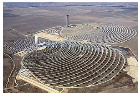
Енергетичні сонячні вежі перероблюють природний ресурс Сонця і є джерелом відновлюваної енергії . На фото: сонячні вежі PS10 та PS20

Стійкий розвиток , сталий розвиток (англ. sustainable development ) — загальна концепція стосовно необхідності встановлення балансу між задоволенням сучасних потреб людства і захистом інтересів майбутніх поколінь, включаючи їх потребу в безпечному і здоровому довкіллі . Як сформулювала визначення сталого розвитку у своїй доповіді Комісія Брундтланд , це «розвиток, який задовольняє потреби нинішнього покоління без шкоди для можливості майбутніх поколінь задовольняти свої власні потреби» [1] .