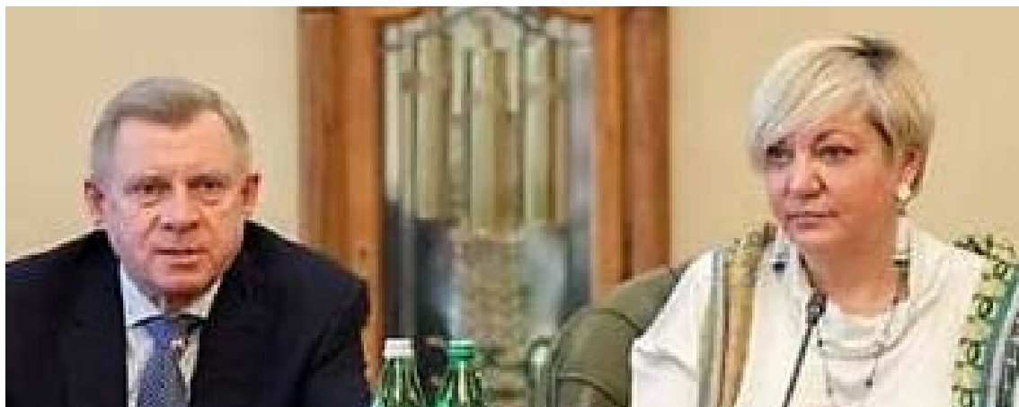
Яков Смолий и Валерия Гонтарева

В апреле 2014 года Яков Смолия назначают заместителем главы НБУ, ставленницы Петра Порошенко, Валерии Гонтаревой .