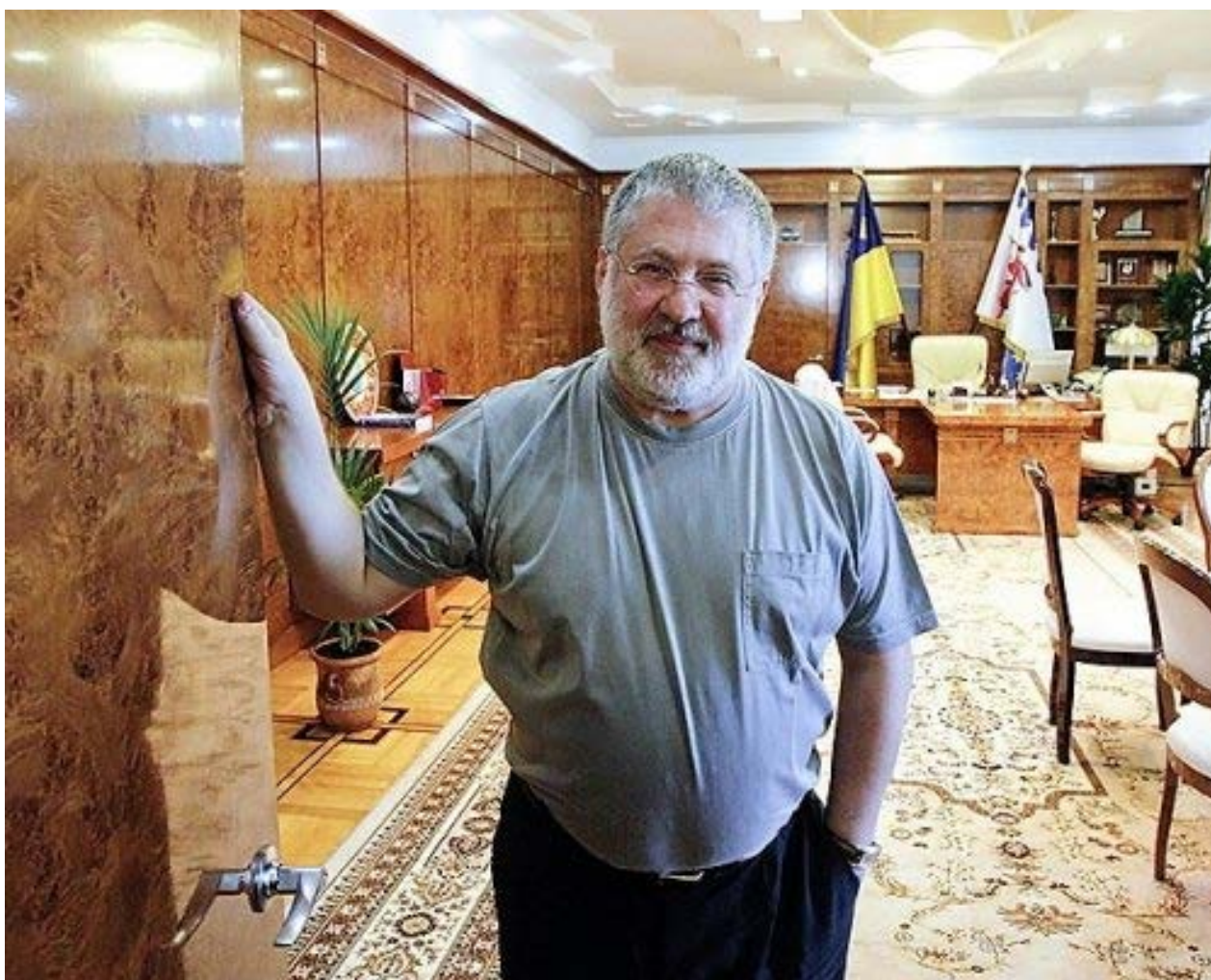
Игорь Коломойский. Ну кто ж его не знает?!