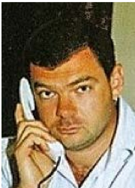
Игорь Палица, 2005 год

Напомним: после бензинового кризиса 2005 года, во многом спровоцированного тем же Коломойским, правительство выделило 2 миллиарда гривен на расширение сети государственных АЗС, работающих от «Укрнафты».