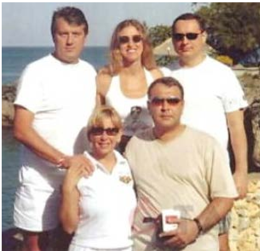
Виктор Ющенко (вверху) Катерина Ющенко и Давид Жвания (внизу)

В 2002 году Давид Жвания был избран в Верховную Раду по списку «Нашей Украины» (№33), и немедленно стал прикрываться своим статусом оппозиционера, когда его предприятия подвергались различным проверкам.