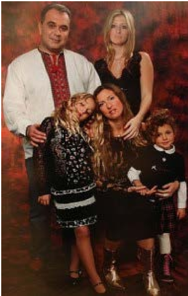
Давид Жвания с семьей

В 2005 году Давид Жвания достиг вершины своего политического могущества – в правительстве Тимошенко он возглавил МЧС Украины, которое, в частности, занимается вопросами безопасности АЭС и вывозом отработанного ядерного топлива.