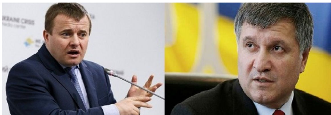
Владимир Демчишин и Арсен Аваков

именно сейчас – точно не известно, однако, ввиду назревающего конфликта между Арсением Яценюком и Петром Порошенко, ставленниками которых являются Арсен Аваков и Владимир Демчишин, – все становится на свои места. Вопрос лишь в том, сумеют ли они договориться, и удержится ли Владимир Васильевич на своей должности.