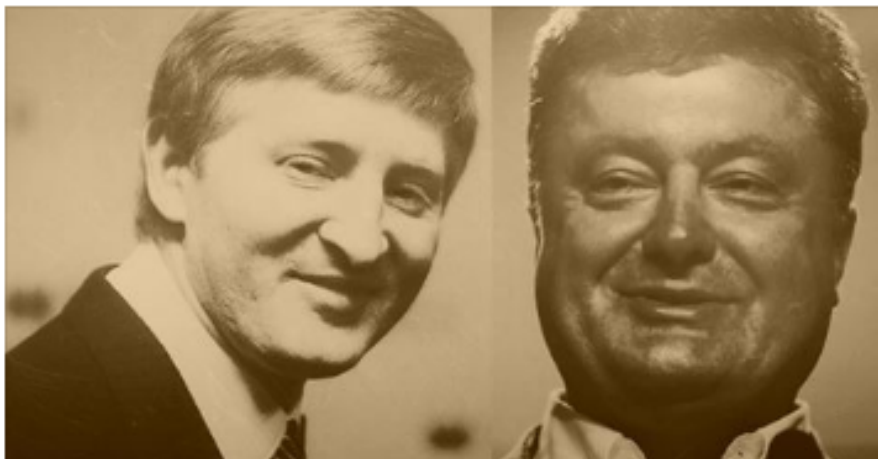
Золотой киловатт Ахметова и Порошенко