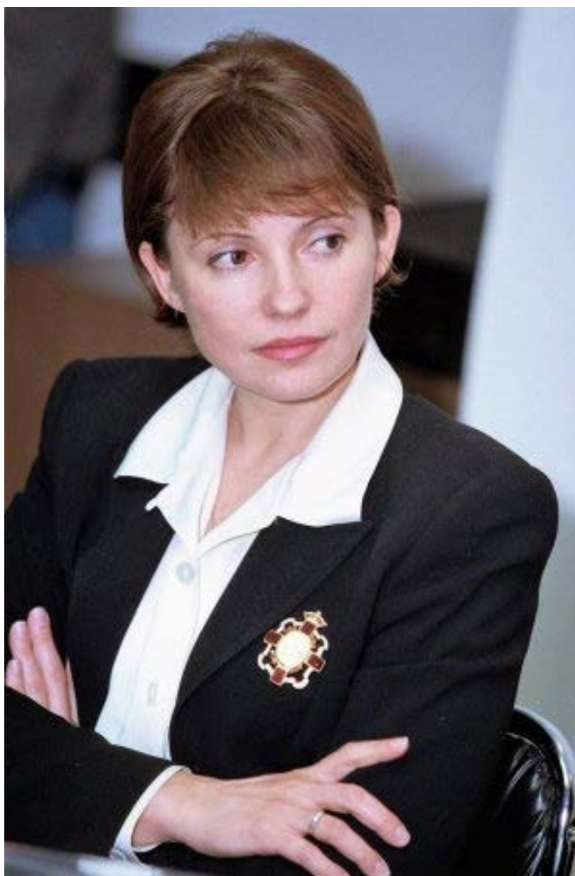
Генеральный директор ЕЭСУ Юлия Тимошенко

В это время усилился газовый кризис в стране: МВФ потребовал от правительства отказаться от роли гаранта по коммерческим газовым контрактам, а российский «Газпром», решив перестраховаться в связи с отсутствием гарантий, предложил включать в сделки государственный «Укргазпром». Однако последний был на грани банкротства. Несмотря на добычу газа в Украине и оплату транзита, у него не было покупателей. «Укргазпром» задолжал бюджету около 3 млн долларов. В 1996 году правительство списало долги госкомпании и открыло рынок для частных торговых компаний. Конечно, все это удачно «запаковали» под «стабилизацию цен и борьбу с государственными газовыми долгами».