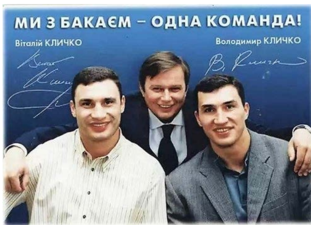
братья Кличко и Игорь Бакай