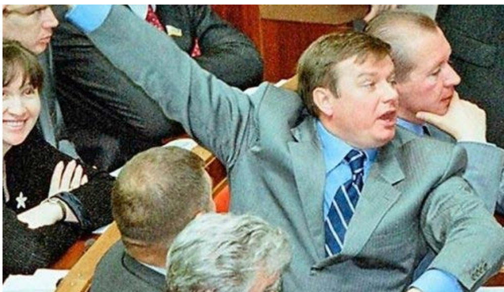
Игорь Бакай в Верховной Раде

Летом 2000 года Бакай вернулся в большую политику. Он выдвинул свою кандидатуру в народные депутаты по освободившемуся избирательному округу в Житомире. На помощь ему пришел Владимир Литвин, который задействовал весь административный ресурс. Жители житомирщины еще долго вспоминали размах предвыборной кампании: проезд популярных российских исполнителей, вроде Кристины Орбакайте, ярмарки и другие пиар-изыски технологов. SKELET-info узнал сумму, которую потратил Игорь Михайлович на политтехнологов – 1 млн долларов. Но они окупились — сверженный газовый магнат победил на выборах.