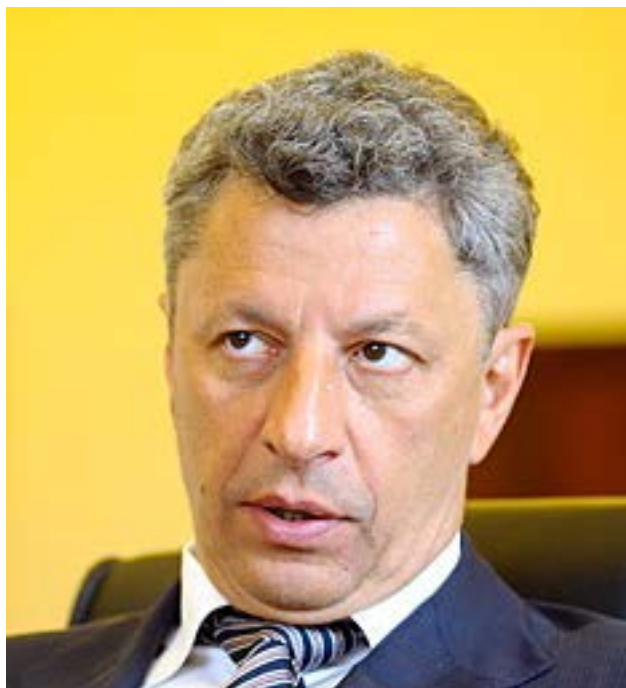
Юрий Бойко министр

24 декабря 2012 года — Юрия Бойко становится вице-премьер-министром по вопросам топливно-энергетического комплекса и угольной промышленности в новоизбранном правительстве Николая Азарова после парламентских выборов.